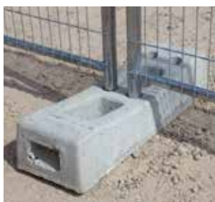
Plot béton (HEPB)