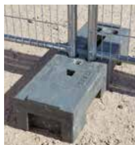
Plot PVC recyclé très résistant (HEPR)