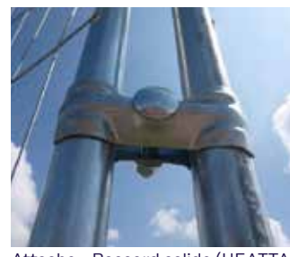
Attache - Raccord solide (HEATTA)