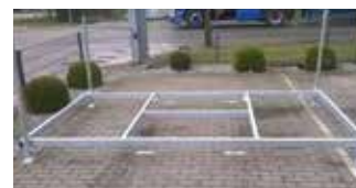
Rack de transport horizontal (HEBOKSTPLAT)