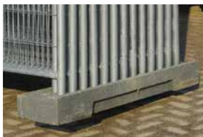
Pied de stockage pour 28 clôtures (HEPR)