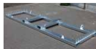
Rack de transport vertical (HEBOKSTTR)