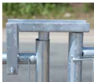
Charnière pour élément de porte (HECH)