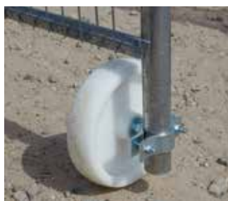
Roue pour élément de porte (HEROUE)