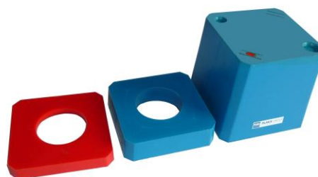
Kubeco à épaisseur réglable 16 / 18 / 20 cm